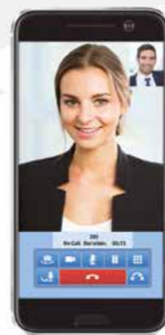
Videollamada La ventana con pantalla doble para usted y su interlocutor facilita considerablemente las conversaciones.